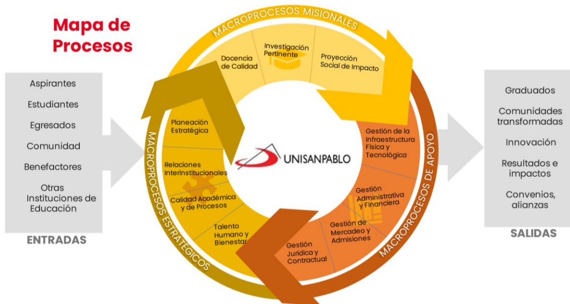
Mapa de procesos UNISANPABLO. Fuente: Oficina Asesora de Planeación. 2023.

Como se aprecia en el mapa de procesos, mediante los macroprocesos se asegura el cumplimiento de la razón de ser de la institución, la ejecución de la estrategia contenida en la estructura del plan (frente, campo y metas), el seguimiento a los Kpis, permite que se genere la gestión del conocimiento y la toma de las decisiones. De igual manera, desde el mapa de procesos se busca el aseguramiento de la calidad a partir de: