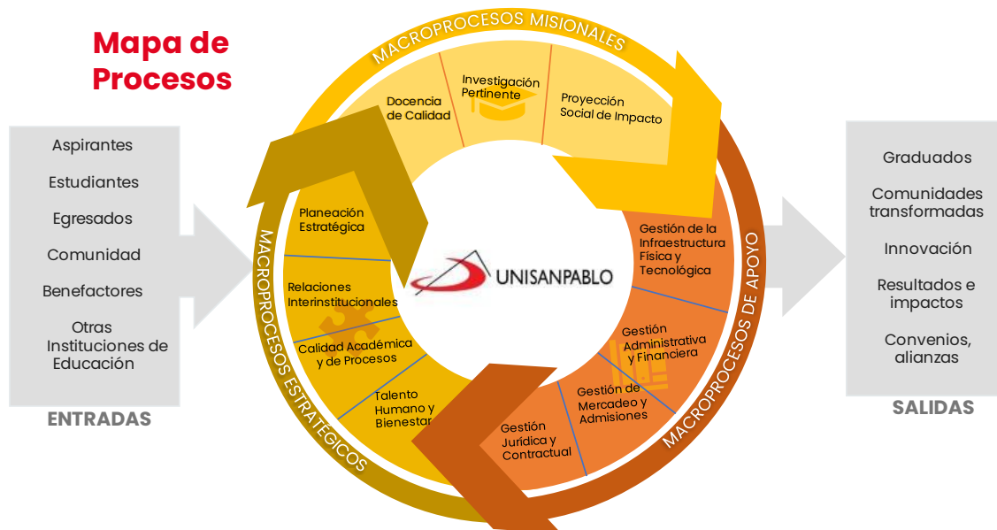
Mapa de procesos UNISANPABLO.

Como se aprecia en el mapa de procesos, mediante los macroprocesos se asegura el cumplimiento de la razón de ser de la institución, la ejecución de la estrategia contenida en la estructura del plan (frente, campo y metas), el seguimiento a los Kpis, permite que se genere la gestión del conocimiento y la toma de las decisiones. De igual manera, desde el mapa de procesos se busca el aseguramiento de la calidad a partir de: